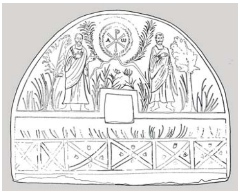
Гробница са фрескама у Јагодин-мали (источни зид)

века. На источном зиду гробнице која је пронађена у насељу Јагодин–мала, а која је датирана у позни IV век, изнад улаза приказан је Христов монограм у венцу од палминог лишћа, док су са његове леве и десне стране представљене две мушке стојеће фигуре (једна држи отворену књигу, а друга благосиља). 11 Као пандан овим представама, на западном зиду гробнице приказан је истоветан мотив за који су раније постојале претпоставке да се ради о представама апостола Петра и Павла. У новије време све су аргументованије тврдње да се ради о представама локалних светитеља. 12